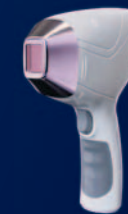
Plamka 20x20 mm