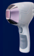
Plamka 12x20 mm