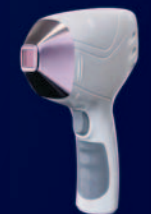
Plamka 12x12 mm